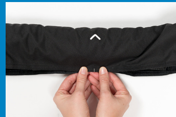
Lukking av yttertrekket. Start fra mitten og følg trykk knappene