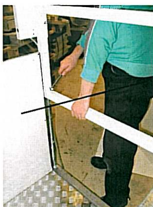
Schaktplåt (sedd från stannplansidan)

Justera schaktväggen mot övre stannplan så att dess överkant är i nivå med stannplanet. Justering görs genom att lossa bultarna i sidoprofilerna bakom schaktplåten så att plåten kan förskjutas i höjddled. Fixera bultarna efter justeringen. Placera hissen så att schaktväggen mot övre stannplan står tätt emot stannplanet.