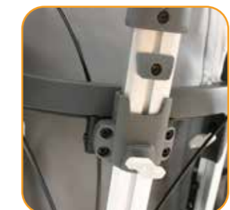
Hodestøttefestet har memoryfunksjon som sikrer samme posisjon etter demontering.