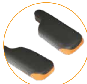
P-formede armlenepads 16 cm brede