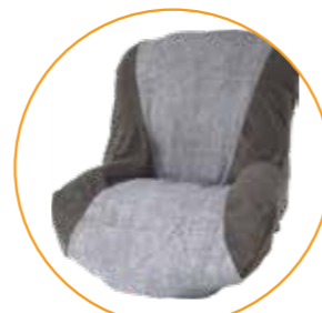
Til hele Nuage PLS setesystem

Bamboo terry trekk er lettere, mykere og føles luftigere. Trekkene er også absorberende.