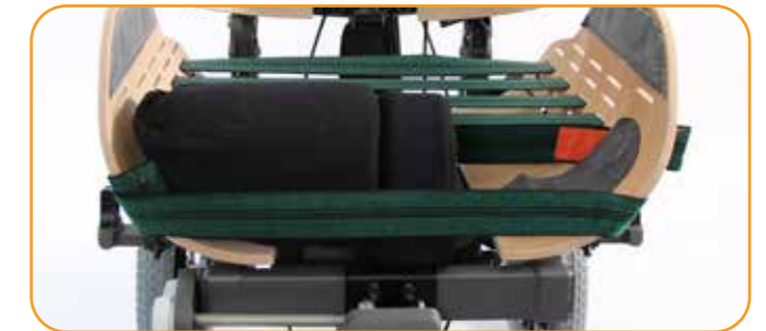
Støtteputer i forkant kan fjernes ved behov for å senke låret.