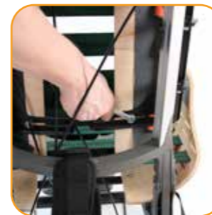
Breddejustering av rygg.