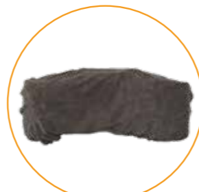
Trekk til hodestøtte og hodestøtte liten