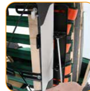
Vinkling av de innebygde sidestøttene.