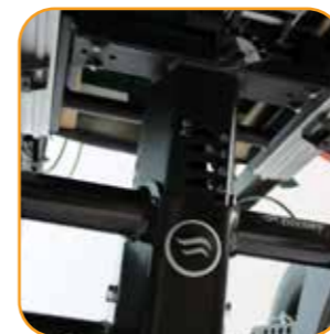
Justeringspunktene for understellet er intuitive og merket med skala for enklere og mer nøyaktig justering.