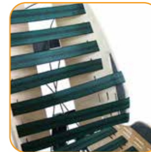
Vinkling av de innebygde sidestøttene.