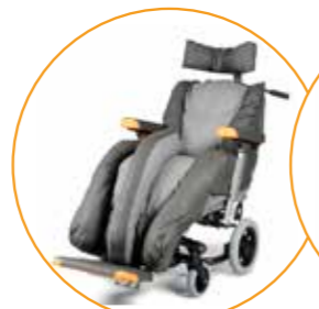
Alle Nuage PLS modellene kan leveres med abduksjonsputer for posisjonering av ben.