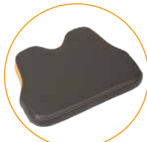
Fotplate liten (Standard på PLS Active XS)