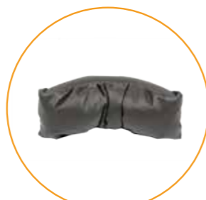
Hodestøtte liten (Standard på PLS Active XS)