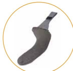
Trekk til fleksible armlener