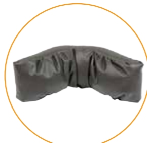
Hodestøtte (Standard på PLS og PLS Active)