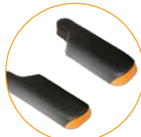
P-formede armlenepads, 12 cm brede (Standard på PLS -serien)