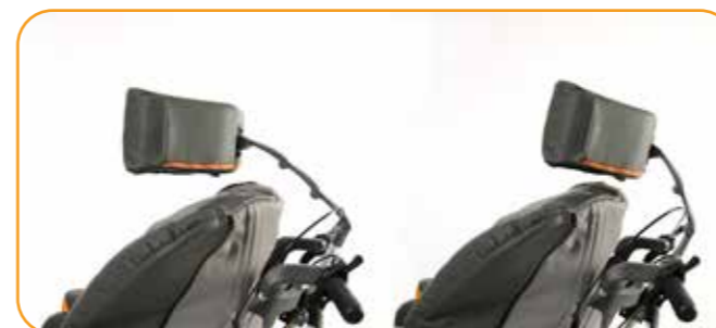
Bred hodestøtte med leddet feste gir god støtte og stabilitet.