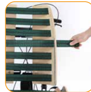
Asymmetrisk, justerbare stropper for individuell tilpassing.

Setet og ryggen består begge av todelte treskall med justerbare stropper mellom. Både treskallene og stroppene kan monteres i ulike posisjoner slik at Nuage PLS kan tilpasses asymmetrisk i tillegg til i høyde, dybde og bredde. Dette gir mulighet til å tilpasse setet til personer med for eksempel kyfose, ulik benlengde, rotasjoner eller bekkenskjevhet. Med Nuage PLS kan du oppnå en komfortabel og individuelt tilpasset sittestilling til de aller fleste.