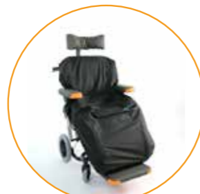
Inkontinenstrekk beskytter stolputen.