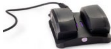
Dokking lader, Art nr: 260242