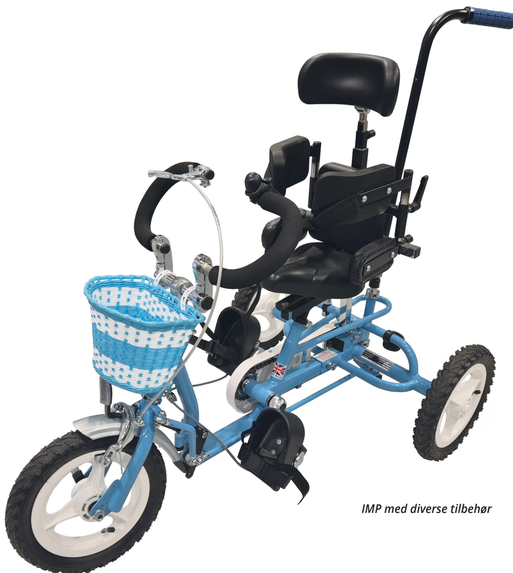
IMP med diverse tilbehør