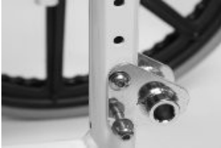
Fig. 1: Hjulsamling monteret på rammen