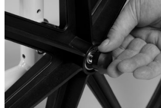
Fig. 3: Hætte til hurtigudløserknappen