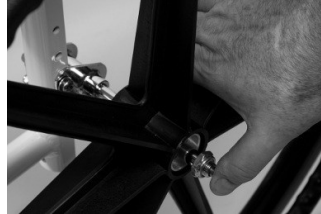
Fig. 2: 24"-hjulet med hurtigudløser