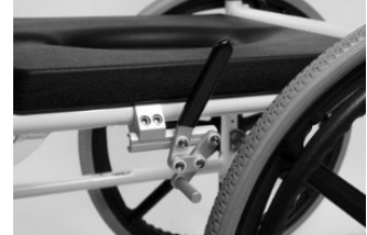
Fig. 4: Montering af bremsen på rammen