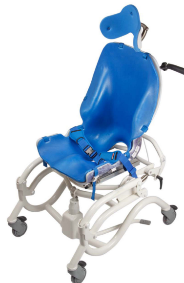
HM Hygienesits med Zitzi Starfish Pro understell

Våre formstøpte seter leveres med et lett aluminiumsskall. Dette gjør det enkelt å montere seteenheten til et av våre godkjente understell.