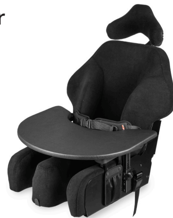
HM Mykstøp med bord

Hjelpemiddelspecialisten har lang erfaring og solid kompetanse i å utvikle seteløsninger som sikrer best mulig sittestilling og optimal posisjonering. Sammen med bruker og nærpå personer utformer vi løsninger som gir god trykkfordeling i sittende stilling, selv når alle andre alternativer er forsøkt.