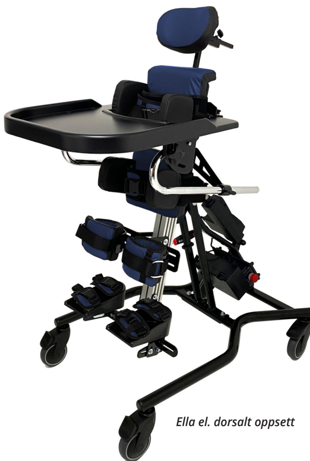
Ella el. dorsalt oppsett