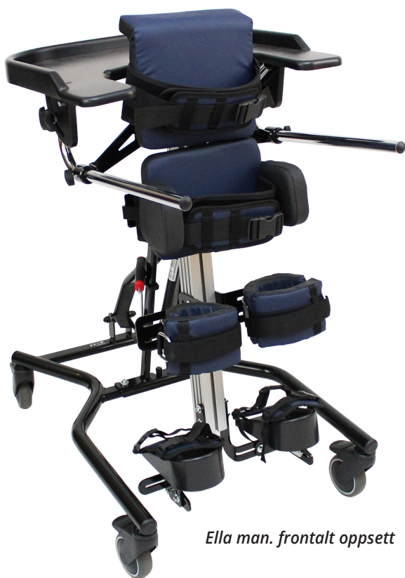
Ella man. frontalt oppsett

Ella er prisforhandlet som nr. 1 og leveres standard som avbildet. Understellet kommer med manuell eller elektrisk hev/senk.