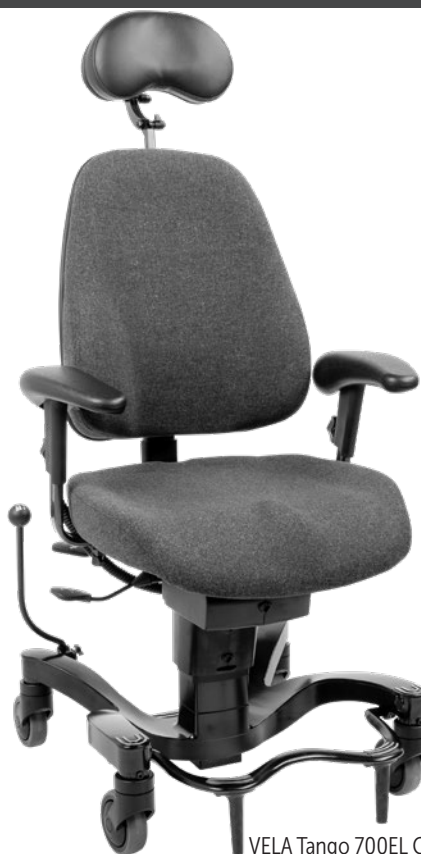
VELA Tango 700EL Contour Stor