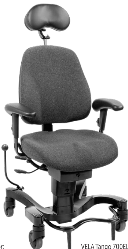
VELA Tango 700EL Contour Medium

Med seterotasjon, høy rygg og nakkestøtte