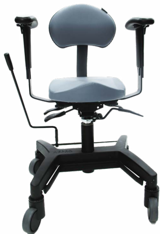
Hepro G2 Ergo Liten med sentralbrems