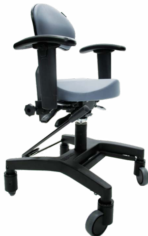
Hepro G2 Ergo Stor med sentralbrems