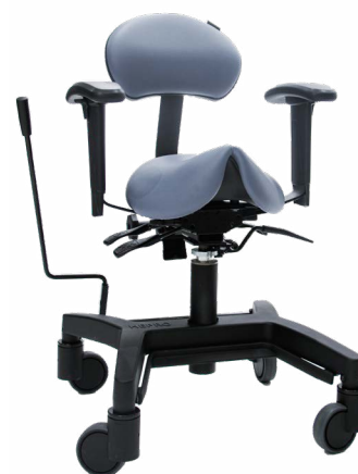
Hepro G2 Sadel Liten med sentralbrems