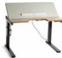
Scriba DK17, DK18, DK19

Arbeidsbord med elektrisk høyderregulering og vinkelregulerbar bordplate.