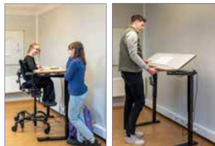
Sitte- eller stå. Scriba stilles enkelt inn til den arbeidshøyden du ønsker i løpet av dagen.