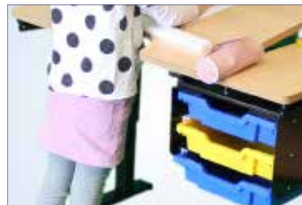
Skuffeksjon til montering under bordplaten gir enkel tilgang til for eksempel skrive- og tegnesaker (tilbehør).