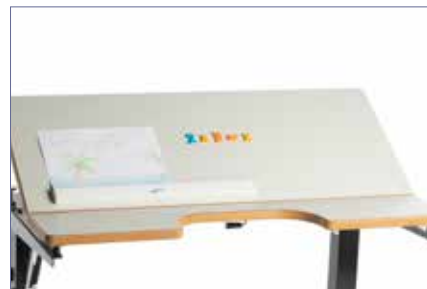
Bruk fantasien til å kombinere læremidler sammen med den magnetiske linjalen og den magnetiske arbeidsflaten.