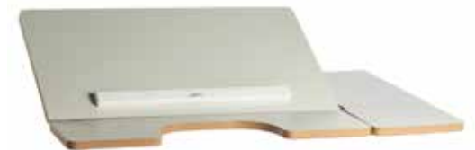
Delt vinkelregulerbar bordplate, venstre