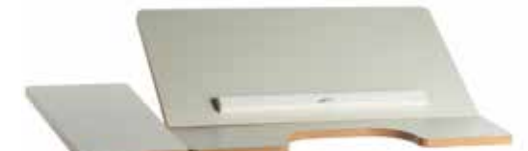
Delt vinkelregulerbar bordplate, høyre