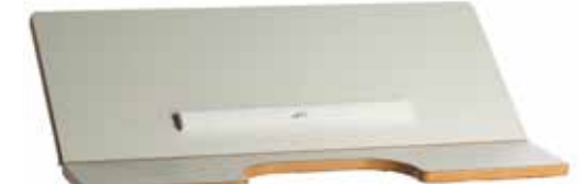
Hel vinkelregulerbar bordplate