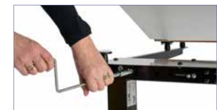
På Scriba med manuell regulering reguleres høyden via en sveiv som monteres på baksiden av bordet.