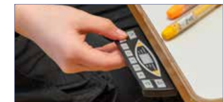
Via et enkelt kontrollpanel reguleres vinkel og høyde på bordplaten på Scriba med elektrisk regulering.