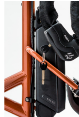
Akkuschlösser und Kettenschloss mit gleichschließenden Schließzylindern

Ein Tastendruck, schon nimmt der Antrieb Last aus dem System und die Rohloff E-14 schaltet. Die Taste halten, und die E-14 schaltet in schneller 3er-Sequenz alle 14 Gänge. Und bei Ampelstopp wird automatisch in den Anfahrang zurückgeschaltet. Die effizienteste und langlebigste Schaltung für E-Bikes mit Mittelmotor - somit ideal für das Strada Tandem.