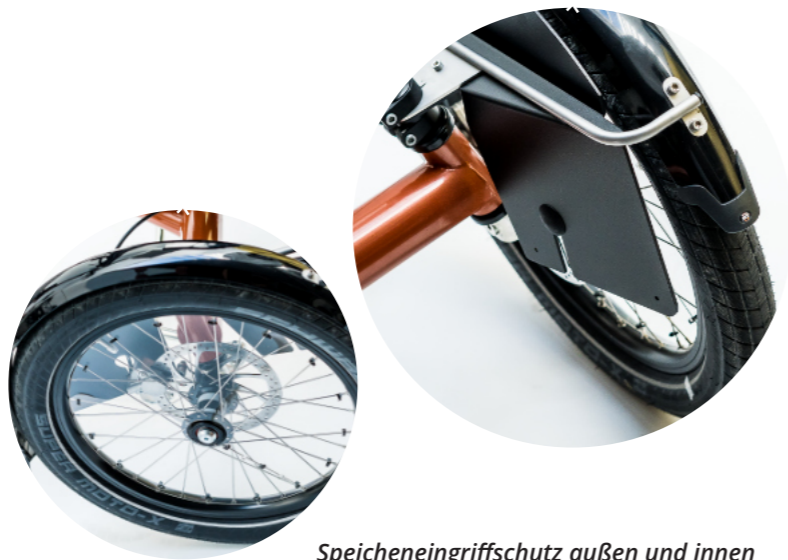
Speicheneingriffschutz außen und innen

Um dem individuellen Bedarf unserer Kunden zu entsprechen, sind manchmal auch Sonderanfertigungen erforderlich. Wir teilen gerne unsere Erfahrung. Sprechen Sie uns an!