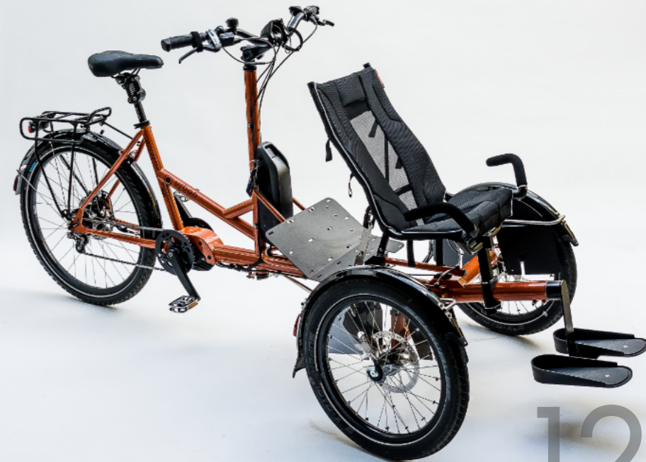
Strada mit Fußschalen und Sitzerrhöhung