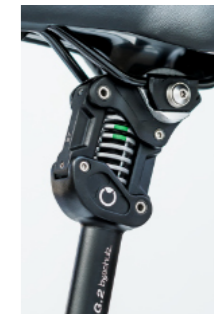
Federsattelstützen bySchulz G2.ST / G2.LT