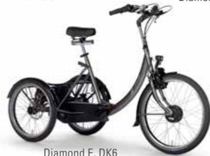
Diamond E, DK6