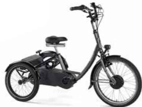
Bondo E, DK6