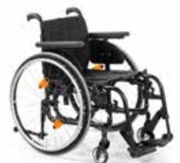
QS5 X DK4

Aktiv rullestol med sammenleggbar ramme med fast benstøtte,