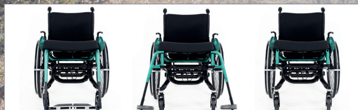
FOTHVILERE KAN ENKELT FJERNES