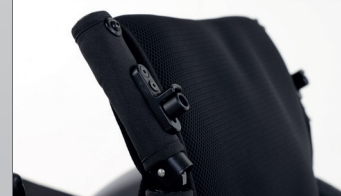
RYGGSTØTTE MED LEDDET HÅNDGREP.