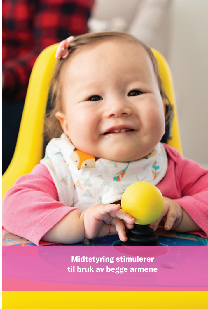
Midtstyring stimulerer til bruk av begge armene