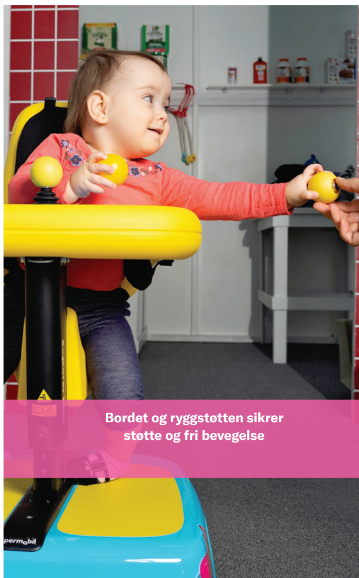
Bordet og ryggstøtten sikrer støtte og fri bevegelse