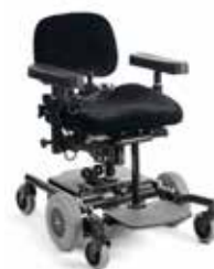
REAL 6100 DK25

Elektrisk rullestol med motorisert styring for innendørs bruk.