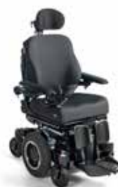
Q300M Mini DK 16

Elektrisk rullestol med motorisert styring for begrenset utendørs bruk med midthjulsdrift