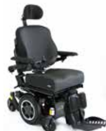
Q300M Mini DK 26