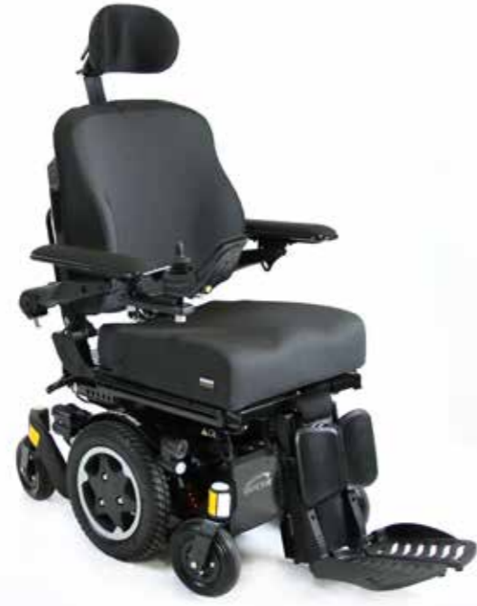
Q300 M Mini- Delkontrakt 26