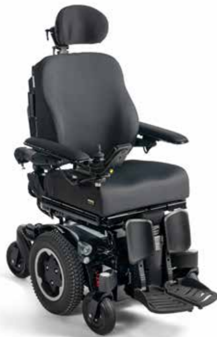
Q300 M Mini- Delkontrakt 16

Delkontrakt 26 - motorisert styring for innendørs bruk med elektriske setefunksjoner - for voksne, 3. valg.