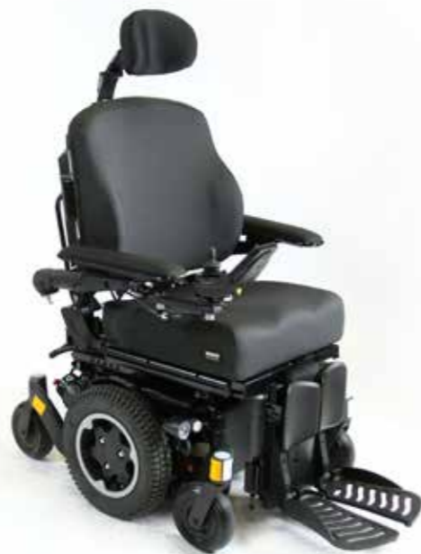
Q500 M - Delkontrakt 16