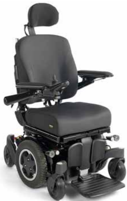
Q500 M - Delkontrakt 14

Delkontrakt 16 - Motorisert styring for begrenset utendørs bruk med midthjulsdrift og elektriske setefunksjoner - for voksne, 1. valg.