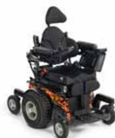
Magic 360 DK11

Elektrisk rullestol med motorisert styring for utendørs bruk med midthjulsdrift