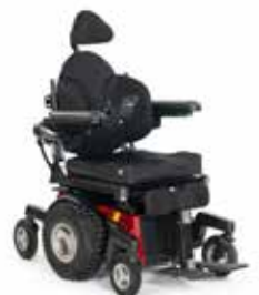
Magic 360 DK10

Elektrisk rullestol med motorisert styring for utendørs bruk med midthjulsdrift