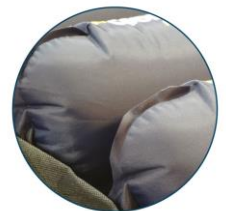
Covert sealed air cells