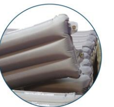
Independently removable cells