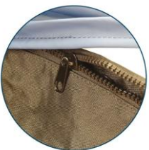
360 Degree zipper