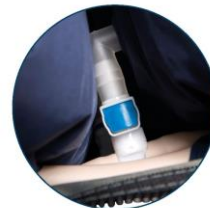
Removable heel cells