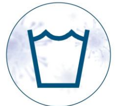
Antimicrobial, machine washable