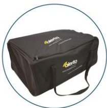
Zipped storage bag