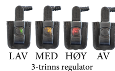
LAV MED HØY AV 3-trinns regulator