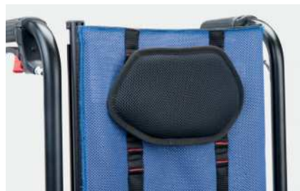
865 Polstret hodestøtte justerbar i høyden.