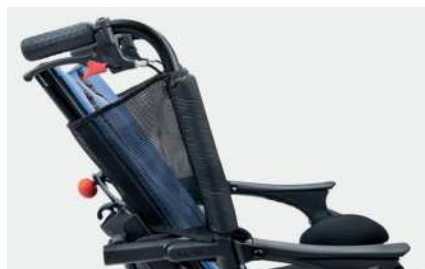
844 Polstret side beskyttelsesdeksler