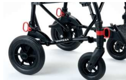
891 Sett med 4 festekroker

Det øker totalhøyden på maks. 7 cm/2,7 in (98-105 cm/38,5-41,3 in).