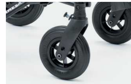
812 Forhjuls retningslåser