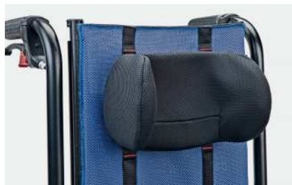
835 Formet og omsluttende hodestøtte justerbar i høyden.