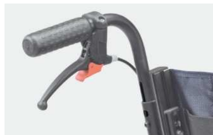
951 Høydejusterbar kjøre håndtak

Det øker totalhøyden på maks. 7 cm/2,7 in (98-105 cm/38,5-41,3 in).