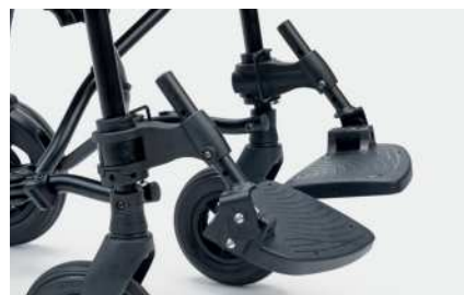
956 Fotstøtter justerbare i tilt