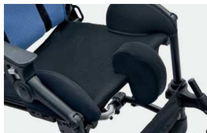
834 Polstret abduksjonsblokk avtakbar

958 Polstret sidestøtter for breddereduksjon sete 32 cm EKSTRA polstring til 28 cm