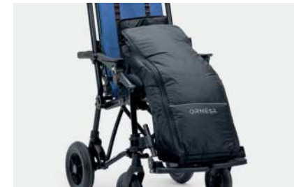
818 Termisk pose / trekk

Ryggbeskyttelse Klut (825B) tilgjengelig for bedre beskyttelse motvær og vind