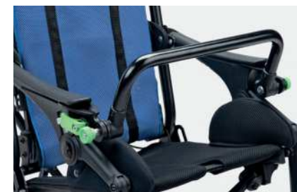
839 Håndtak foran

958 Polstret sidestøtter for breddereduksjon sete 32 cm EKSTRA polstring til 28 cm