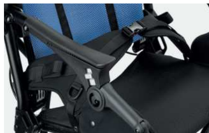
920 Firepunkts bekkenbelte Tilgjengelig i to størrelser.