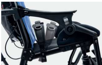
947 Bekkenbelte med variabel vinkel Tilgjengelig i to størrelser.