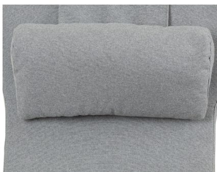
Nakkepute nr 5 Dråpeform m/fiberfyll, formbar