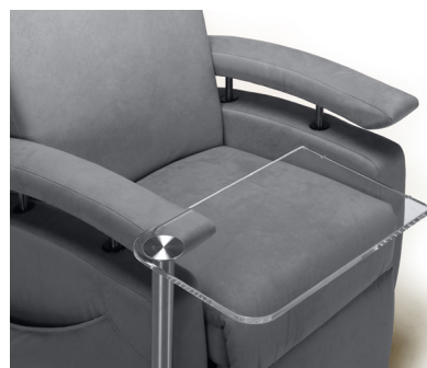
Bord transparent svingbart