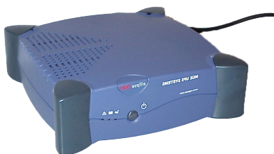
Batteri Back Up (stol fungerer ved strømbrudd)