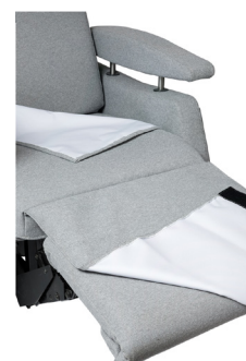
Inkontinestrek, sete og benstøtte