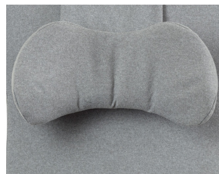
Nakkepute nr 11 Hodestøtte med sidestøtte formbar i skum