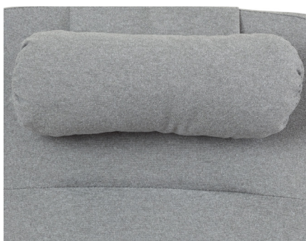
Nakkepute nr 3 Stor m/fiberfyll, formbar