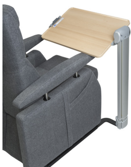
Bord fellbart og svingbart. Regulerbart i høyde, dybde og vinkel.