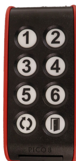
IR-styring Betjeningsboks til IR styring Fitform trådløs lettbetjent. Stolen kan også styres med spesial- styringer som f.eks øyestyring Tobii etc. Be om mer info.