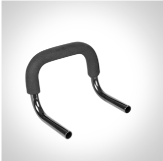
Kjørebøyle str. 1