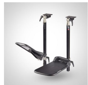
Fotstøtte - delt