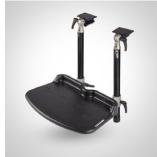
Fotstøtte - hel