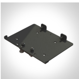
Festesystem til Delfi