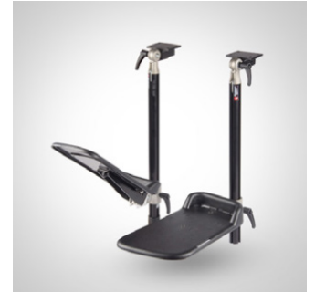
Fotstøtte - delt