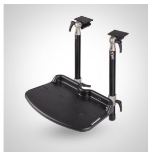
Fotstøtte - hel