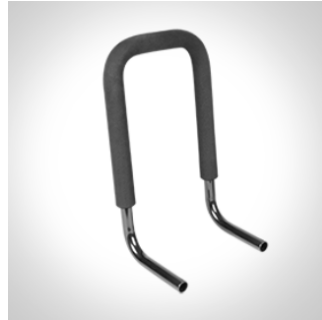
Kjørebøyle str. 2