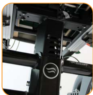
Justeringspunktene for understellet er intuitive og merket med skala for enklere og mer nøyaktig justering.