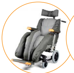
Alle Nuage PLS modellene kan leveres med abduksjonsputer for posisjonering av ben.