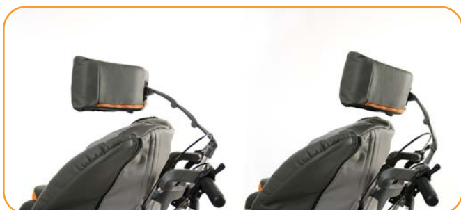
Bred hodestøtte med leddet feste gir god støtte og stabilitet.