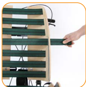
Asymmetrisk, justerbare stropper for individuell tilpassing.

Setet og ryggen består begge av todelte treskall med justerbare stropper mellom. Både treskallene og stroppene kan monteres i ulike posisjoner slik at Nugae PLS kan tilpasses asymmetrisk i tillegg til i høyde, dybde og bredde. Dette gir mulighet til å tilpasse setet til personer med for eksempel kyfose, ulik benlengde, rotasjoner eller bekkenskjevhet. Med Nuage PLS kan du oppnå en komfortabel og individuelt tilpasset sittestilling til de aller fleste.