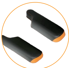
P-formede armlenepads, 12 cm brede (Standard på PLS -serien)