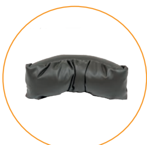
Hodestøtte liten (Standard på PLS Active XS)