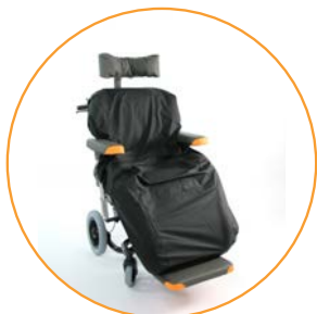
Inkontinenstrekk beskytter stolputen.