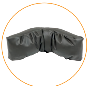
Hodestøtte (Standard på PLS og PLS Active)