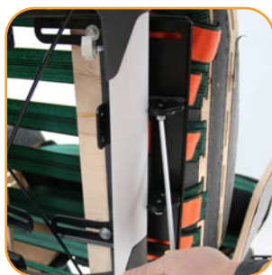
Vinkling av de innebygde sidestøttene.