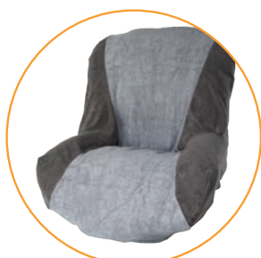
Til hele Nuage PLS setesystem

Bamboo terry trekk er lettere, mykere og føles luftigere. Trekkene er også absorberende.