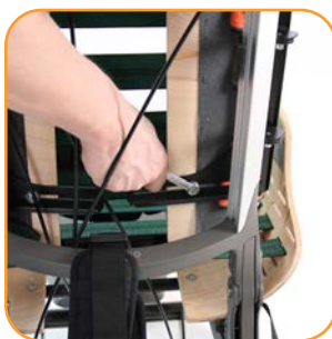
Breddejustering av rygg.