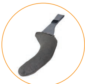
Trekk til fleksible armlener