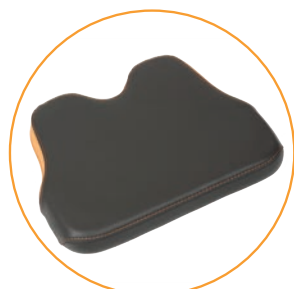
Fotplate liten (Standard på PLS Active XS)