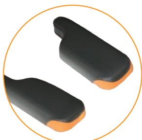
P-formede armlenepads 16 cm brede