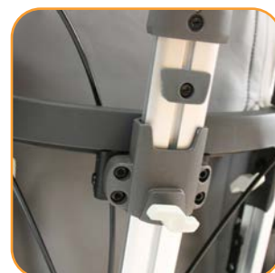
Hodestøttefestet har memoryfunksjon som sikrer samme posisjon etter demontering.