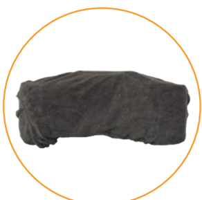
Trekk til hodestøtte og hodestøtte liten