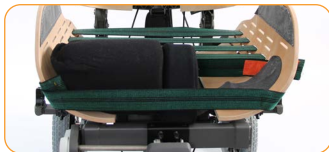
Støtteputer i forkant kan fjernes ved behov for å senke låret.