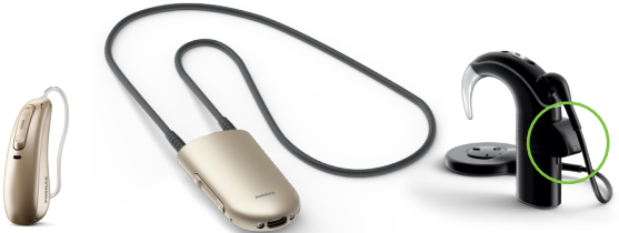
Høreapparat med RogerDirect

I høreapparater med RogerDirect™ kan mottakeren installeres direkte. Det er ikke nødvendig å bruke en ekstern mottaker. For andre typer høreapparater og implantater finnes det flere typer mottakere.