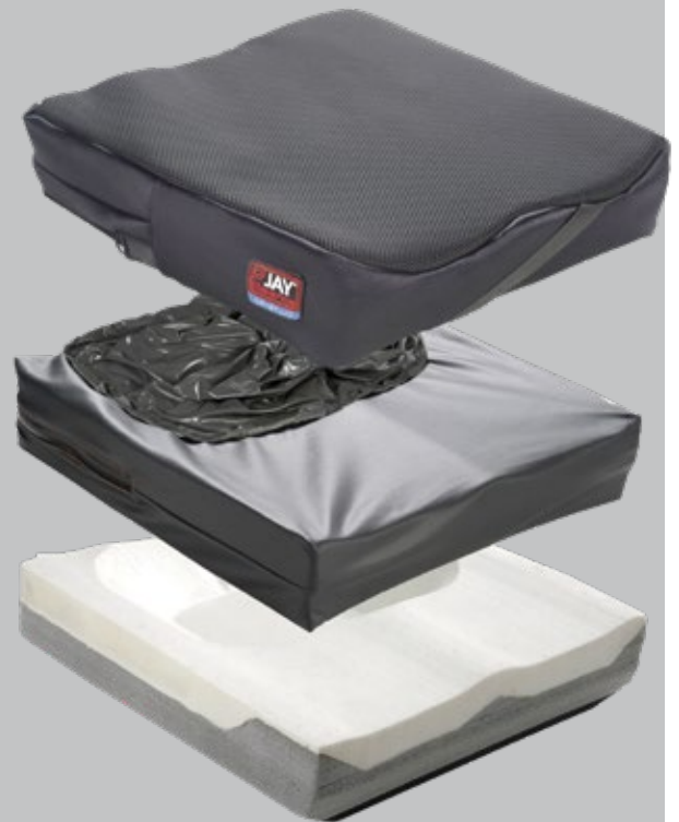
JAY Balance med Cryo Fluid

JAY Balance benytter Dual-trekk teknologi. Det innovative trekket består av et indre og et ytre trekk og balanserer dermed kravene til et godt mikroklima og effektiv beskyttelse av basen. JAY Balance kan leveres med tre ulike typer trekk, mikroklimatisk trekk, stretch trekk og inkontinenstrekk.