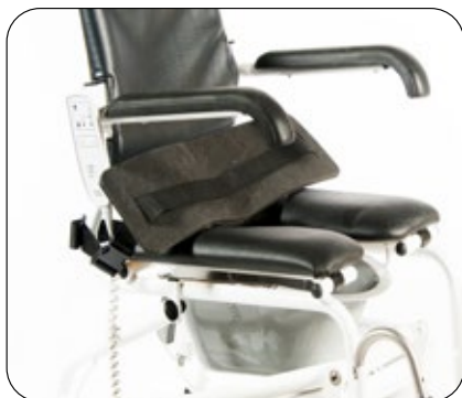
Behagelig polstret hoftebelte for god støtte i alle posisjoner. Standard på Ergotip- Art.nr. ERGO-SSB