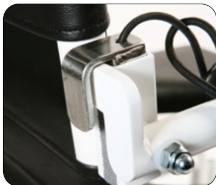
Armlenelås vil sikre at ikke armlenet vippes opp utilsiktet. Enkel i bruk. Art.nr: 01043

Det finnes et stort utvalg av tilbehør; bl.a sikkerhetsbøyle, armlenelås, nakkestøtter, vinkelregulerbare leggstøtter, amputasjonsstøtte, seter med og uten åpen front og lokk til mange av setene. Se tilbehørslisten på side 6.