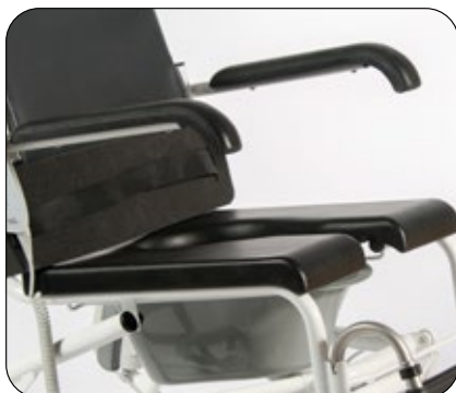
Sete med åpen front, PUR sete (polyurethan). Leveres som standard til Ergotip 5 og 6. Polstret sete med åpen front er standard til Ergotip 7-11. Pur sete med lukket front kan fås som tilbehør.