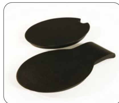
Setelokk kan fås til flere av PUR-setene (ikke til polstret sete.)