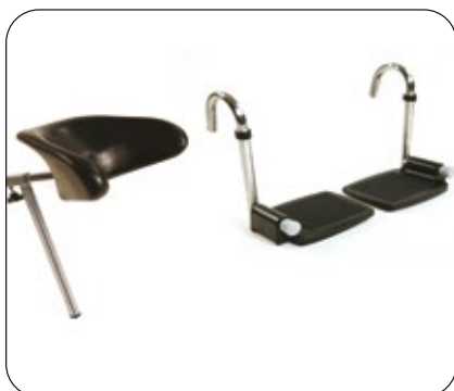
Ergotip 5-6-7-8-9 el leveres med benstøtter, grå bøtte og hodestøtte som standard. Art.nr: 01055 Benstøtte,par og art.nr Ergo-NI for standard nakkestøtte