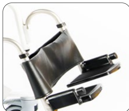
Her vises justerbart polstret leggbånd for god fotstøtte ved tilting! Art.nr: 01052