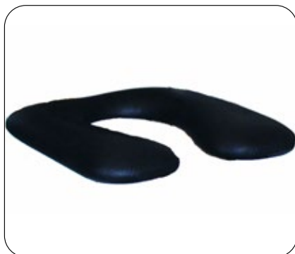
Sete med åpen front, polstret sete er standard på Ergotip 7-11. PUR-sete med lukket front finnes som tilbehør.