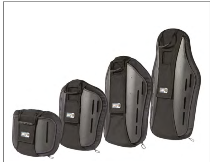
Levo kan påmonteres faste rygger som Jay.