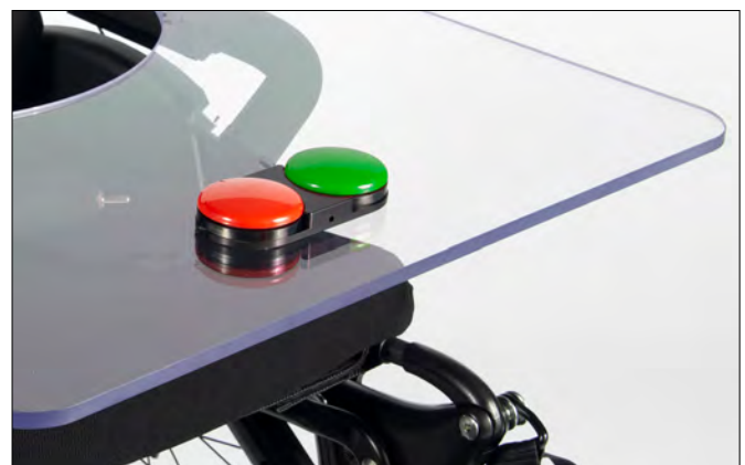
Levo kan leveres med alternative brytere for oppreisingsfunksjon, her vises buddy buttons montert på bord.