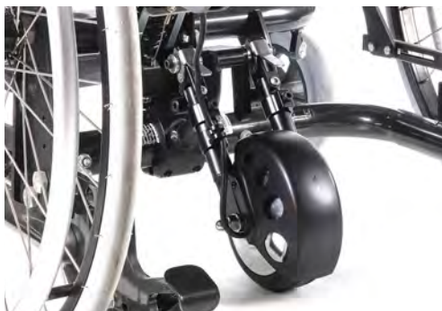
Empulse R20 ledsagerstyrt drivaggregat.