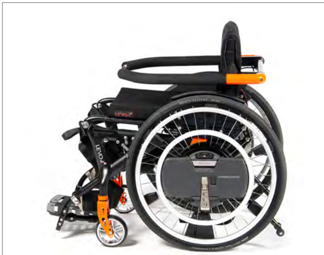
Wheel Drive hjelpestarer ved bak hjul for til Levo Summit.