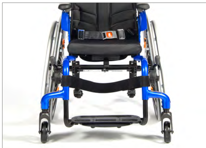
Cambringsalternativer 0°/3°/6°/9°. Camber gjør stolen mer stabil sideveis, enklere å manøvrere og mer retningsstabil på hellende underlag.