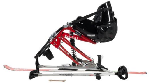
Praschberger Monoski egenkjørt