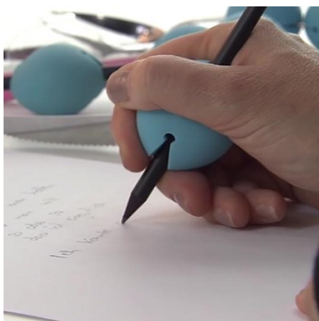
Gripehjelpemidler / Grepsballer

I vår velferdsbutikk kan man blant annet kjøpe disse produktene: