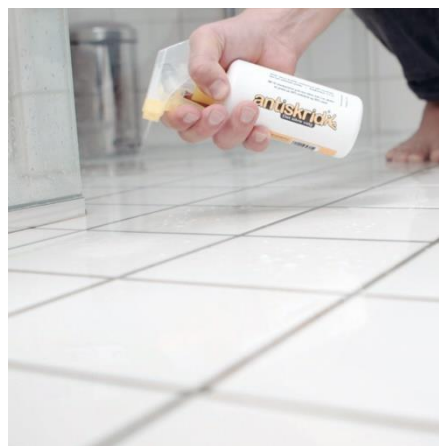
Fallforebygging / Antiglid spray