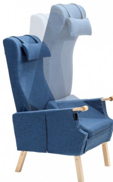
Løftestol / Active EasyRiser