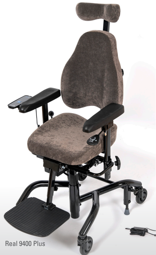
Real 9400 Plus

Arbeidsstolen for aktivitet og høy komfort