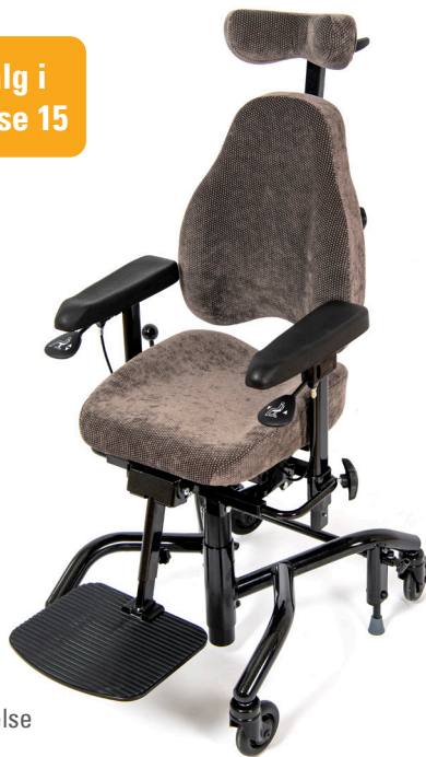
Real 9300 Plus i standard utførelse