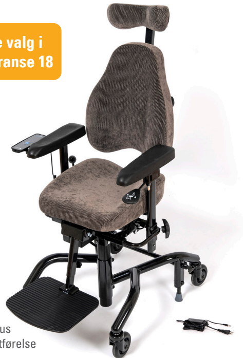
Real 9400 Plus i standard utførelse