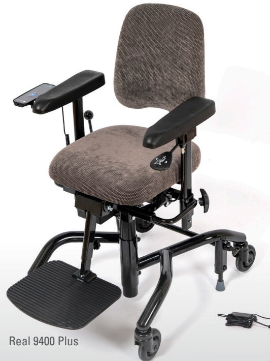
Real 9400 Plus