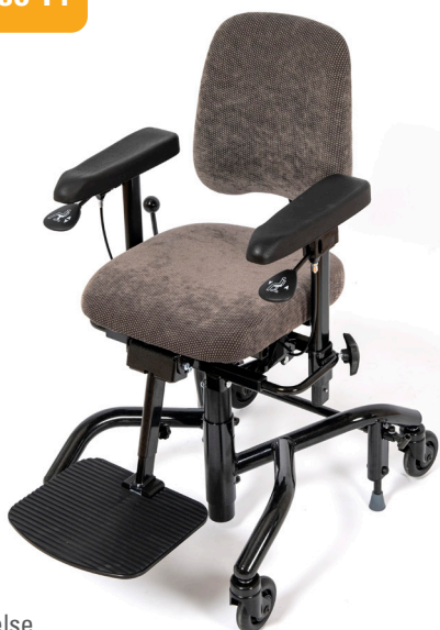
Real 9300 Plus i standard utførelse