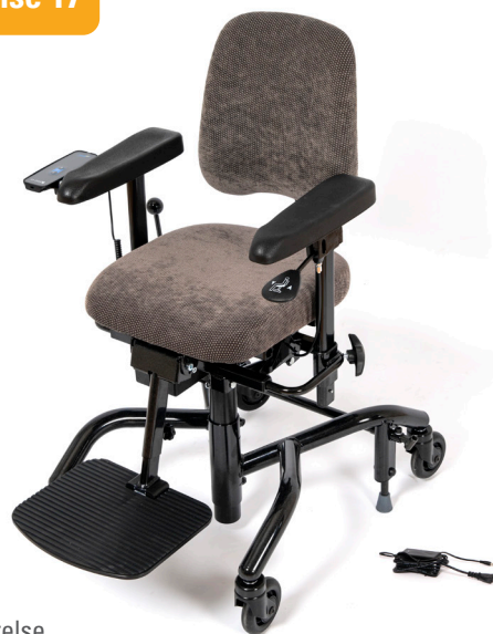
Real 9400 Plus i standard utførelse