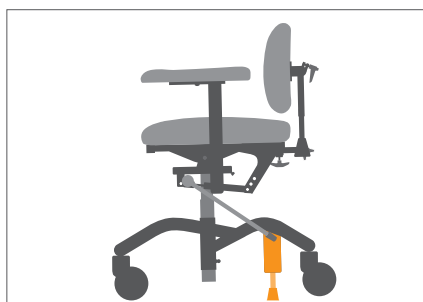
Brems mot gulv gir tryggere forflytning.