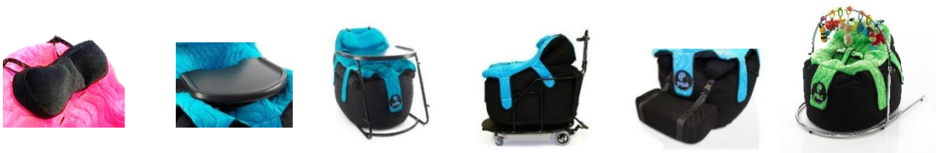
Nakkestøtte, 3 kammer

Forskjellig tilbehør kan benyttes ut ifra behov, med tanke på både komfort og tilrettelegging for aktivitet.