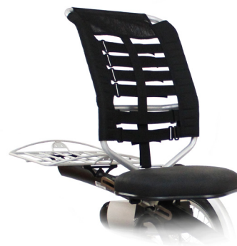
Easy Rider seterygg

Easy Rider som har hjelpemotoren på framhjulet har antispinn, som gjør at framhjulet ikke spinner fritt ved glatt underlag