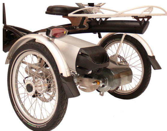
Litium Ion-batteri på Easy Rider Junior