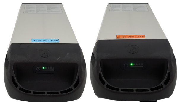
Litium Ion-batterier for Easy Rider og Easy Rider Junior 36V 11Ah (standard), og 36V 25Ah

Batteriet vil, hvis det ikke er brukt på noen dager, gå over i sovemodus for å spare batteriene. For å «vekke» batteriene så kan man enten sette inn ladekontakten eller man kan sykle noen tråkk og samtidig holde inne startknappen på displayet. Displayet på cockpiten vil da lyse opp og hjelpemotoren vil fungere. I tillegg er det en av/på-knapp som «vekker» batteriet når det er i dvalemodus.