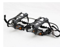
Pedalsett med tåklips og strikk (tilbehør)