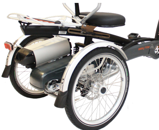
Litium Ion-batteri på Easy Rider