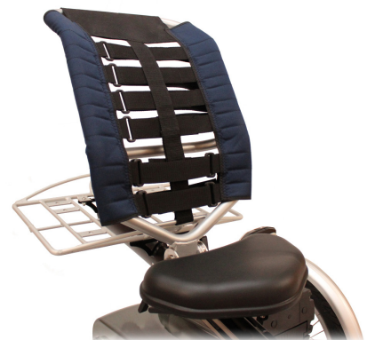
Easy Rider Junior seterygg

Ettersom det er barn og ungdom som ofte bruker sykkelen, kommer den unike hjelpemotoren til sin rett. Ettersom hjelpemotoren individuelt kan tilpasses hver brukers behov, som for eksempel maks hastighet, gjør den Easy Rider Junior til en sikker sykkel.