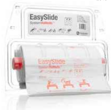
EasySlide, engangs, 2040