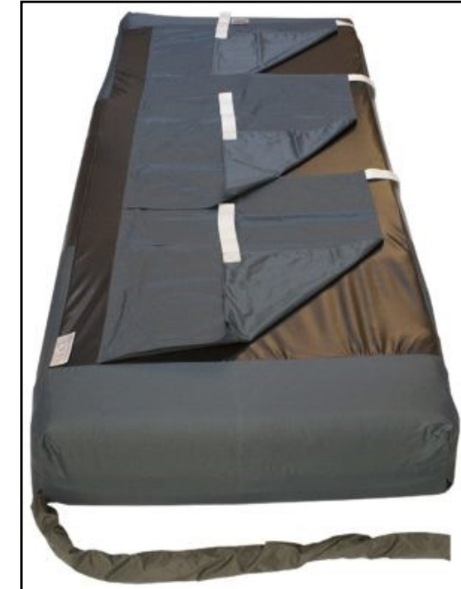
MADRAS COVER EXCHANGE 3 kuvertlaken med tre flyttbare gli-defelt, som kan monteres på alle typer vekselstrykkmadrasser.

Madrasscover Easy 3 Large-c (L200 x B90 x H15 cm)