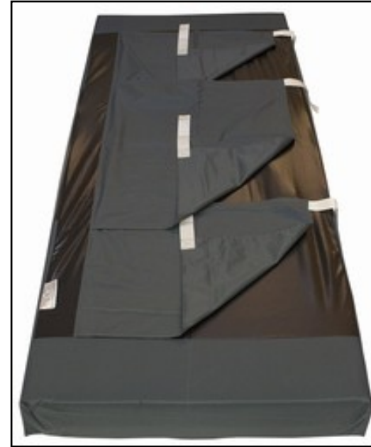
MADRAS COVER EASY 3 kuvertlaken med tre flyttbare gli-defelt, som kan monteres på alle typer skummadrasser.

FINNES I STØRRELSER: Madrasscover Easy 3 XXXL (L210 x B145 x H13 cm)