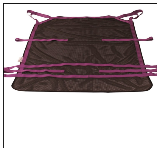
MASTETURNER® BATH Løfteseil og glide-vendelaken i ett. Til overflytning fra seng til badebåre/badekar. Deretter kan det brukes til vending