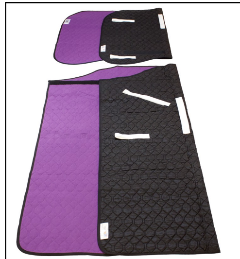
MASTETURNER® DUO til pleietrengende brukere som motarbeider ved vending og i forbindelse med stell nedentil