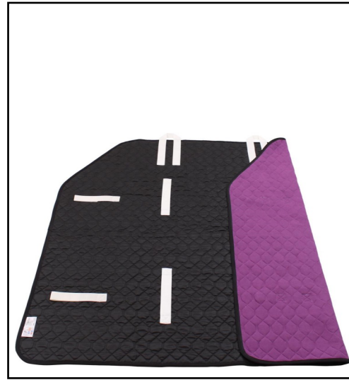
MASTETURNER® MEDIUM brukes til brukeren som har funksjon i benene med behov for nedsatt friksjon under hode, skuldre, rygg og bekkenparti.