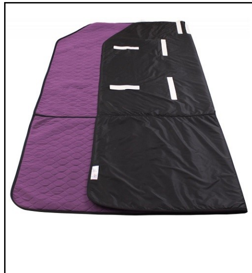
MASTETURNER® X-LARGE brukes til pleietrengende, bariatriske brukere