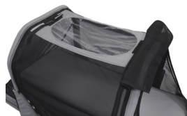
Safety Sleeper med vinyltak til kamera

Sengen kan tilpasses den enkeltes behov for tilgangspunkter (åpninger for slanger/ medisiner/sonde osv), takheis, innganger med mer.