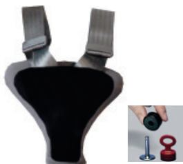
Sikkerhetspad for spenne, med/uten magnetlås