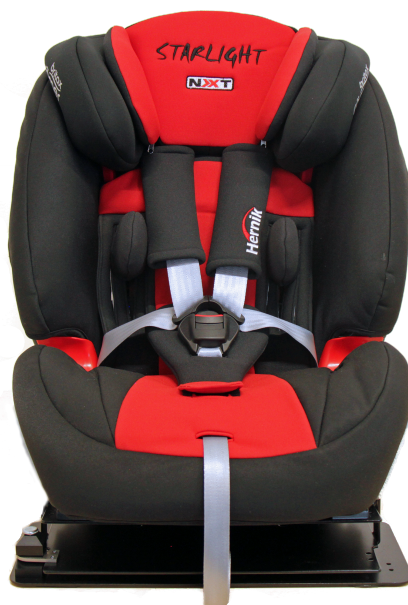
STARLIGHT REHA-NXT rød/svart