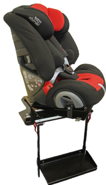
Dreieplate og fotbrett