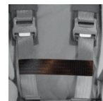
Belte for å redusere skulderbredde