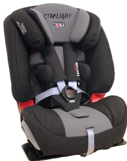
STARLIGHT REHA-NXT grått/svart