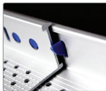
Enkel, og sikker låsefunksjon