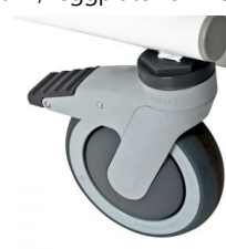
4503-1018/19/20, hjul m/retningslås