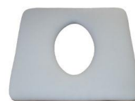
4507-1017, sete pols forl. smalt hull