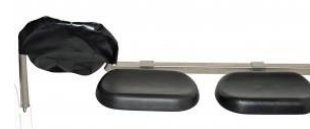
4508-1027, leggplate for vreg benst.