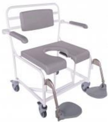
M2 XXL stoler

I tillegg kan det leveres spesialproduserte stoler i M2 serien for de mer spesielle behovene.