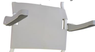
4521-1041, ryggovtrekk mykt