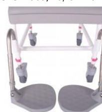
4508-1022, benstøtter stor fotplate