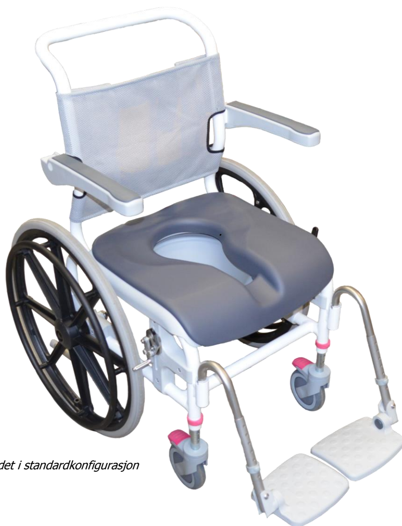
Avbildet i standardkonfigurasjon

Nielsen Line Drivhjul er en meget stabil og lettkjørt stol i aluminium.