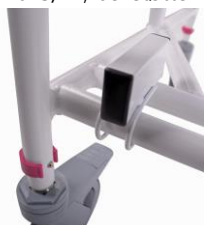
4513-1089, brakett mot negativ tilt