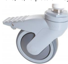
4503-1025, hjul 125mm M2