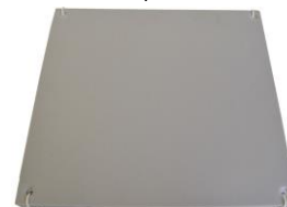
4507-1014, setepute Supersoft

I tillegg til avbildet og opplistet tilbehør kan det leveres spesialtilpasning og spesialversjoner av M2-serien.