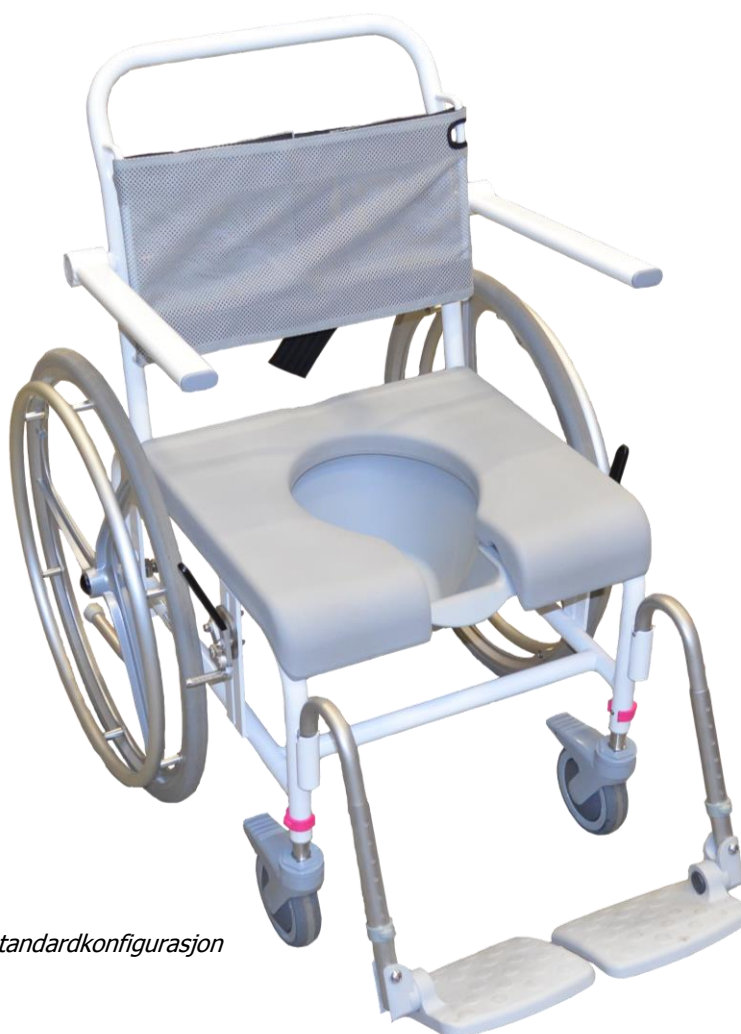
Avbildet i standardkonfigurasjon

M2 Drivhjul er en meget stabil og funksjonell stol for de krevende behovene.