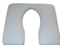
4507-1016, sete pols forl. smalt hull