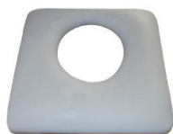
4507-1015, sete pols forl. std. hull