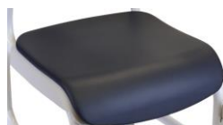
4507-1012, setelukk Nielsen Line