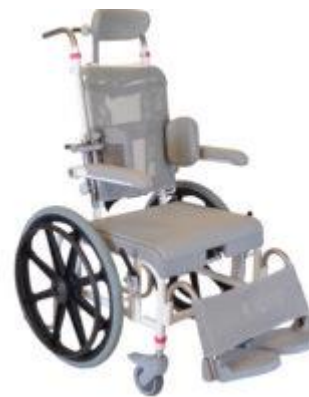
M2 Mini stoler