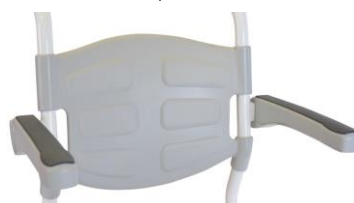
4521-1037, rygg plast Nielsen Line