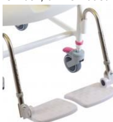
4508-1020, benstøtter forlenget