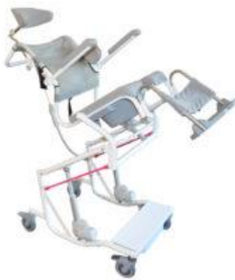
M2 Multi Tipp stoler