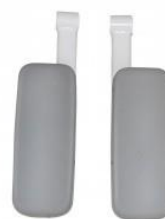
4513-1079/80, Hemiarmen M2