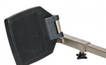
4508-1025/26, fotplate til vreg benst.