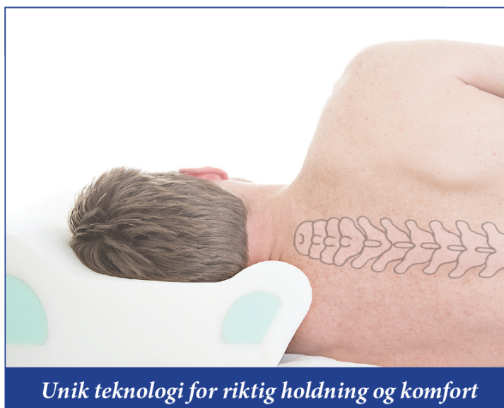
Unik teknologi for riktig holdning og komfort

Få tvil om viktigheten av en kvalitetsmadrass. Men å ha rett pute er minst like viktig. Tross alt bruker du en tredjedel av livet ditt i sengen. En feiljustert rygggrad strammer nakken og skuldrene og kan lett føre til smerte. En riktig utformet pute bidrar til å