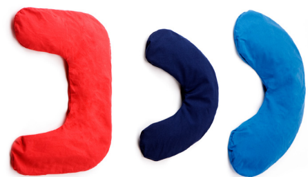
Lasal nakkeputer - u-formede