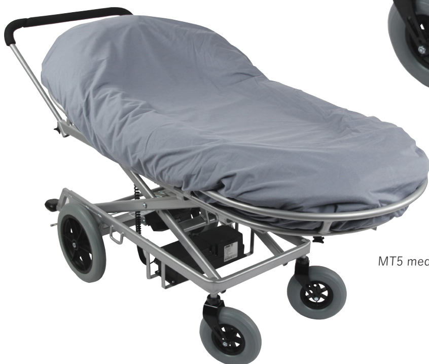
MT5 med trekk