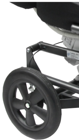
Kompakte hjul m/trommelbrems