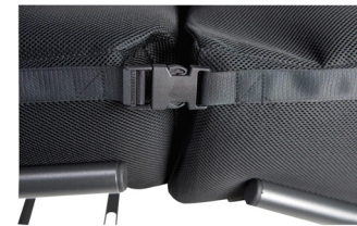
Klips for å feste modulputene