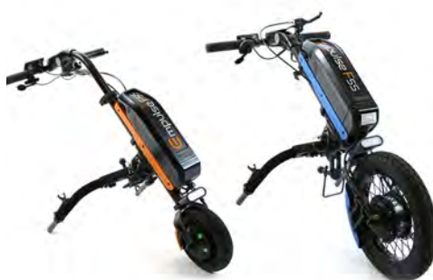
Empulse F55 Drivaggregat med manuell styring.