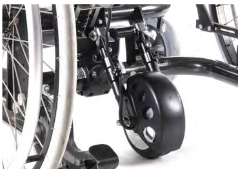
Empulse R20 ledsagerstyrt drivaggregat.