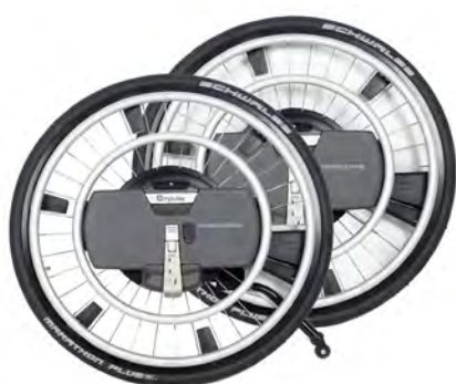
Empulse WheelDrive Drivhjul med elektrisk motor.

Les mer om drivaggregater på vår hjemmeside www.SunriseMedical.no eller i vår katalog Manuelle rullestoler og drivaggregater.