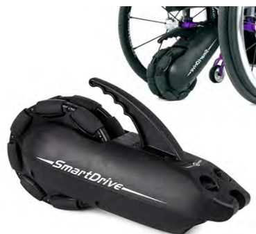
SmartDrive brukerstyrt drivaggregat.