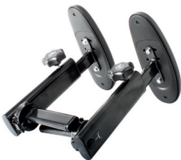
Armlenesett nedfellbare Tango 100 serie