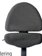
Rygg ALB, aktiv regulering

Brukes kun for disse stoler: VELA Tango 100-serien