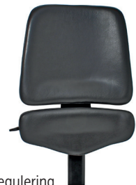
Rygg ALB aktiv regulering