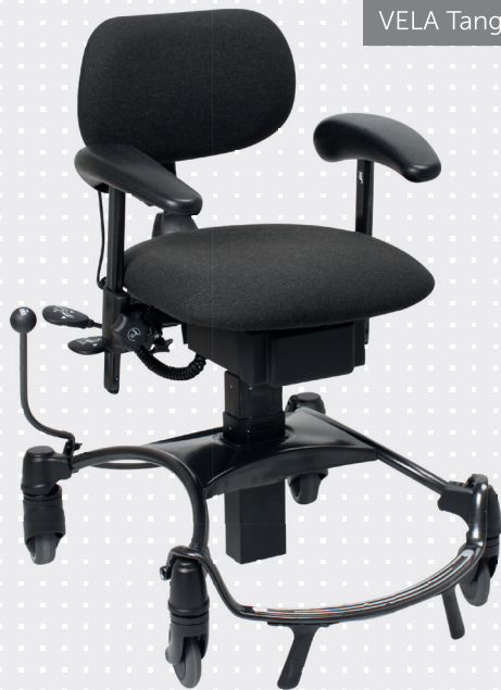
VELA Tango 100EF-1