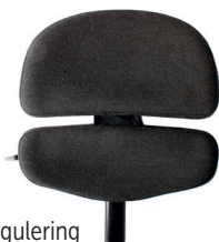
Rygg ALB, aktiv regulering

Brukes kun for disse stoler: VELA Tango 500-serien