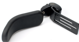
Kroppsstøtte med buet pute

Brukes kun for disse stoler: VELA Tango 100-serien