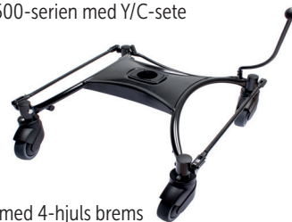
Understell med 4-hjuls brems