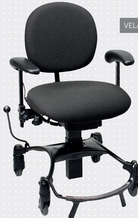
VELA Tango 100EF-3

VELA Tango 100EF-1 til brukeren som har behov for en mindre sitteenhet.