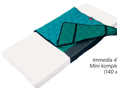
Immedia 4WayGlide Mini komplett system (140 x 100 cm).

Systemet fremmer selvstendig eller assistert bevegelse. Sklisikring langs sidene av nylonlakenet minimerer risikoen for at brukeren sklir ut av sengen.