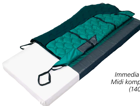
Immedia 4WayGlide Midi komplett system (140 x 150 cm).

4WayGlide Midi er en medium variant (150 cm) i-seng system egnet for tunge brukere med delvis mobilitet i bena. 4WayGlide Midi er utstyrt med LPL funksjon (se side 12)